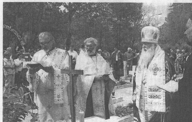
Die Gedenkfeier steht heuer im Zeichen der 65. Wiederkehr des dunkelsten Schicksalstages der Kosaken