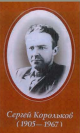
Сергей Корольков (1905—1967)

The dramatic scenes as told by eye witnesses captured in an oil painting by Sergej G. Korolkoff (1905-1967) from the year 1957.