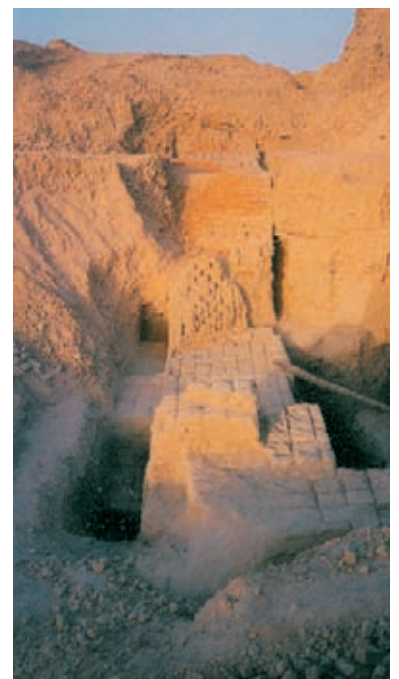
Oben: An der westlichen Ecke des Turms legten die Forscher einen Tiefschnitt an, um tiefere Bau-schichten zu ergründen. F.: Kuntner Links: Die Rekonstruktion des Stufenturmes nach Wilfrid Allinger-Csollich sieht eine niedrigere unterste Stufe vor. Rek.:Allinger-Csollich