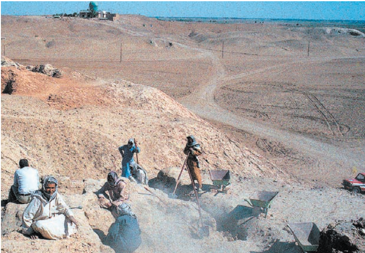
Arbeiter graben am Ezida-Tempel. Seine Geschichte konnten die Forscher aufdecken.