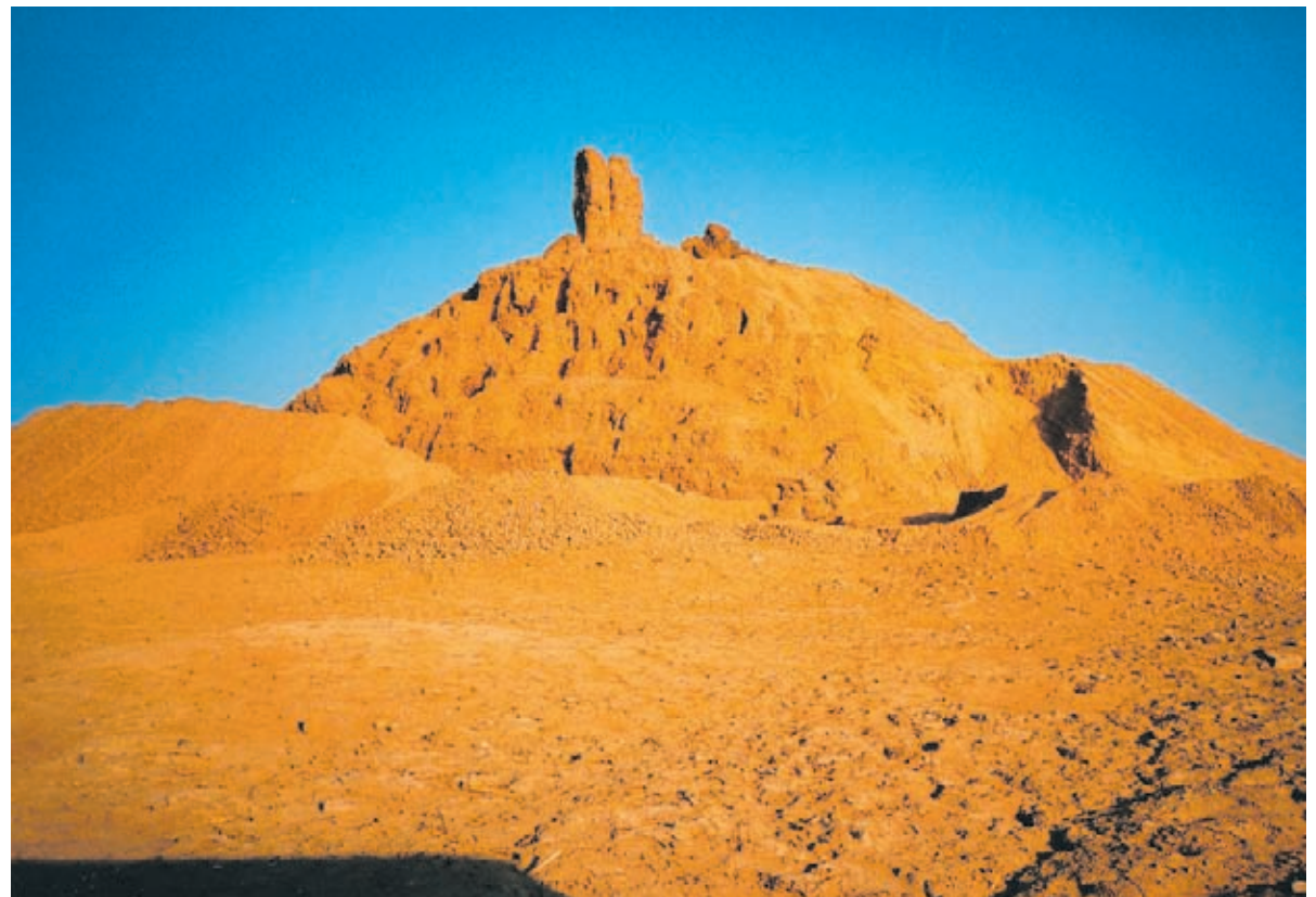
Der Stufenturm von Borsippa: Er war Nabü, dem Gott der Schreibkunst und Weisheit, geweiht.

Bis ins Jahr 2000 gruben die Innsbrucker trotz der Kriege jedes Jahr im Irak. Mit dabei waren je drei bis vier Studierende und Vermesser, hinzu kamen die einheimischen Grabungsarbeiter. In den Jahren 2002/03 wandten sich die Wissenschaftler der Erforschung des Stadtgebietes zu, wurden