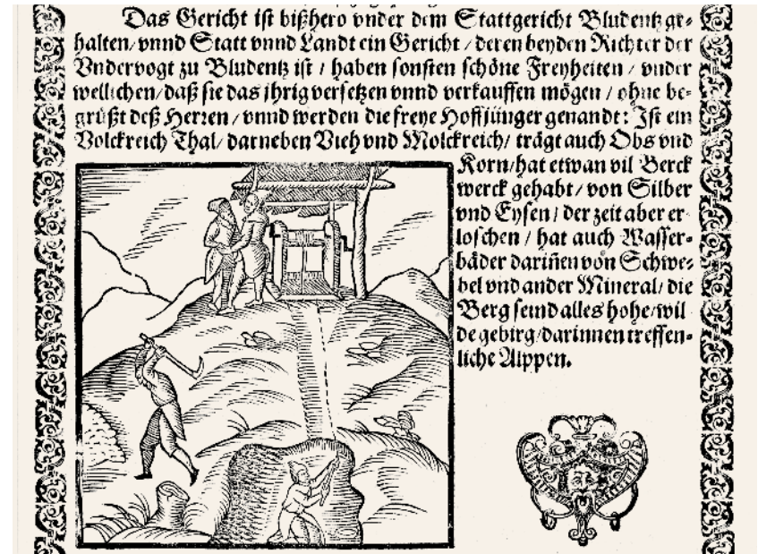
Bergwerksszene (Embser Chronik 61)

pendarstellungen und Bildschmuck zum kunst- und sozialhistorischen Inhalt. Die Technik des Holzschnittes im Buchdruck erreichte ihren Höhepunkt im 16. Jahrhundert, was zahlreiche Holzschnittbücher belegen. 31 Die Holzschnittillustrationen im 17. Jahrhundert stellen nicht mehr hauptsächlich religiöse Themen dar, sondern dem Humanismus entsprechend auch verschiedene Bereiche des menschlichen Lebens. 32 Ein schönes Beispiel mit Holzschnittillustrationen dieser Zeit wäre die bereits erwähnte Beschreibung der Eidgenossenschaft des Johann Stumpf aus dem Jahre 1548, die eine noch größere Anzahl an Wappenillustrationen aufweist als die »Embser Chronik«. Gedruckt wurde die erste Ausgabe des Werkes bei Christoph Froschauer in Zürich, jener Druckerei, in welcher der Lehrherr des Hohenemser Druckers Bartholomäus Schnell, Leonhard Straub 33 , sein Handwerk lernte. Die Kenntnis der Gestaltung solcher Druckwerke könnte auch die Gestaltung der »Embser Chronik« beeinflusst haben. 34