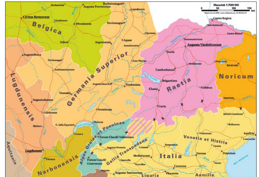
Raetia, Römisches Straßennetz um ca. 150 n. Chr.