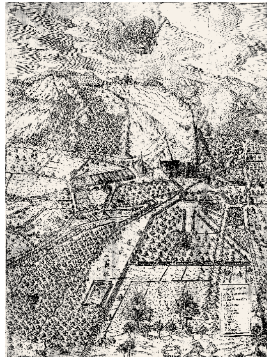
Stadtansicht Hohenems (Embser Chronik zwischen 36 und 37)