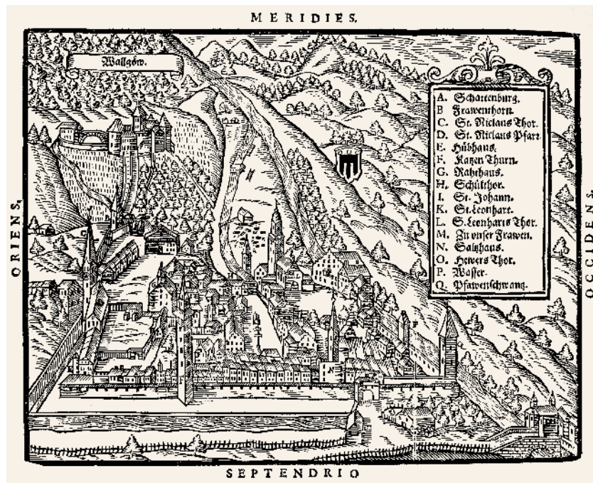
Stadtansicht Feldkirch (Embser Chronik zwischen 42 und 43)

Hohenems wird so zum Mittelpunkt der »Embser Chronik« was den Umfang, die zeitliche Dimension, die historische Bedeutung sowie die Gestaltung der Darstellung anbelangt.