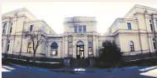
Das Zvezdica Muzej in Sarajevo war der Austragungsort der internationalen Konferenz

Jene, die selbst in Katastrophen waren, informierten jene, die für