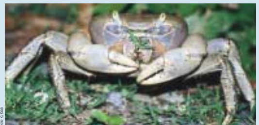
Das Männchen der Winkerkrabbe ist ein wahrer „Casanova“.

nahe verwandten Gruppe machen“, so Sturmbauer. Seine molekulargenetischen Forschungen beweisen das Gegenteil. Eine Reihe von Arten der Winkerkrabben aus dem Indopazifischen Raum wurde bisher verhaltensmäßig und stammesgeschichtlich als „komplex“ klassifiziert, weil diese dieselben „Finessen“ bei der Balz und beim Brüten haben wie die Arten an der mittelamerikanischen Küste. Sie haben ihre abgeleiteten Merkmale aber parallel und unabhängig von ihren mitelamerikanischen „Kollegen“ erworben. „Die nach wie vor anerkannte These der Evolutionsbiologie, laut der Merkmale im Laufe der stammesgeschichtlichen Entwicklung zwangsläufig komplexer werden, ergab sich in diesem Fall als Trugschluss. Unsere Ergebnisse zeigten, dass auch hochkomplexes Brutverhalten mehrere Male unabhängig voneinander entstehen kann. Für das Verhalten ist