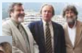
Prof. Lew Zybatow (oben mi.) stellte die EuroCom-Methode vor, die den Spracherwerb deutlich erleichtert. Das Interesse war sehr groß (Bild li.).

durch systematisches Analysieren der Ähnlichkeiten und Unterschiede der Sprachen mit Hilfe der sogenannten „Sieben Siebe“ das