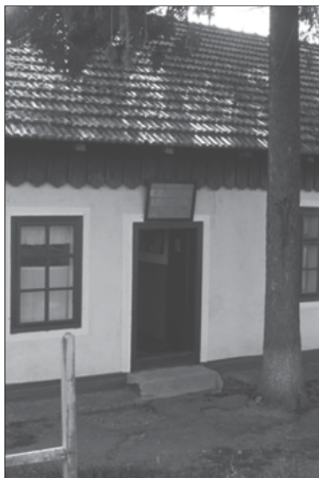
Abb. 4: Der Zerfall der Sowjetunion bedingte auch einen Rückgang in der ärztlichen Versorgung besonders ländlicher Gebiete. Hier ein ‚Feldscher-Punkt‘ (eine Art ärztliche Erstversorgung mit angeschlossener Apotheke durch besonders qualifizierte Sanitäter) im Raum Storoschinez. Die Medikamente sind teuer, das Sortiment dementsprechend klein und der Sanitäter oder Arzt bekommen eine lächerliche, staatliche Entlohnung, die kaum zum eigenen Überleben reicht.

Orientierungslosigkeit, wie er in anderen Teilen der ehemaligen Sowjetunion durch die Veränderungen des vergangenen Jahrzehnts gemessen werden kann, teilweise ab. Die Südbukowina oder das heutige rumänische Suceawer Distrikt zählt Jahrzehnte lang zu den innerrumänischen Entwicklungsgebieten. Im Gegensatz zu