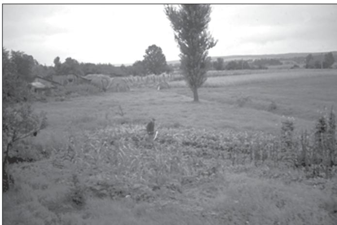
Abb. 7: Im Flachland wurde der extensive Eigenanbau auf kleinen Nutzflächen zur Überlebensnotwendigkeit. Die Produkte werden teils für den Eigenbedarf und teils für den Verkauf des Marktes erwirtschaftet.

von Siedlern aus den westlichen Gebieten des Reiches. Hier beginnt ein dritter Faktor neben der Siedlungs- und Staatsentwicklung eine wesentliche Rolle zu spielen: die ‚Nationalität‘. Geht man davon aus, dass sich der Neusiedler am Ende des 18. und während der ersten Hälfte des 19. Jahrhunderts vor allem in einem gemeinsamen kulturellen Hintergrund durch seine