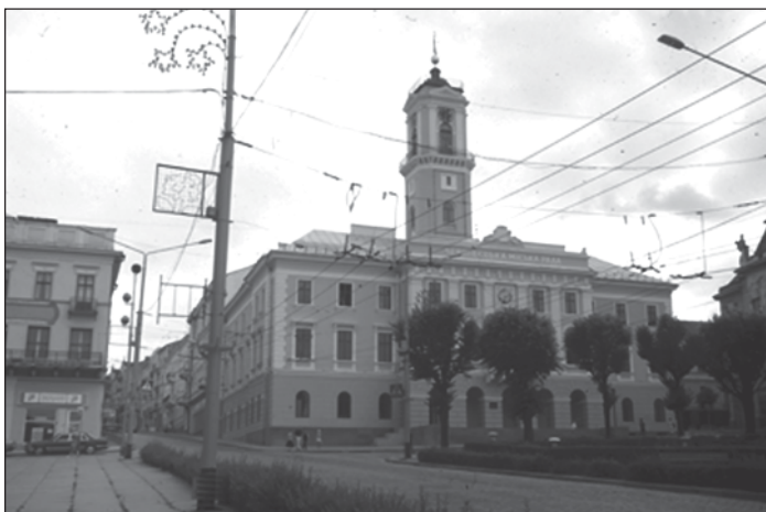
Abb. 1: Das Rathaus von Czernowitz, noch gut erkennbar: Die heute nicht mehr funktionierende sowjetischen Dekoration der Oberleitungsmasten mit den Lautsprechern.

trennte, aber im Wesentlichen ideologisch ähnliche Wege. Die vergangenen 12 Jahre hingegen bewirkten eine grundsätzliche Differenzierung der zweigeteilten historischen Kulturlandschaft. Während sich Rumänien auf dem Kurs der Konsolidierung in Richtung Europäische Union befindet, versinkt der zweitgrößte Flächenstaat Europas, die Ukraine, in einem Chaos korrupter Verwaltung und verhinderter Reformen - eine Entwicklung, die sich gerade in der Landschaft deutlich sichtbar machen lässt.