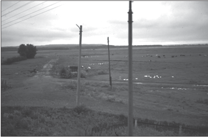
Abb. 5 und 6: Zunehmend extensivere Landwirtschaft kennzeichnet die ehemals staatlich betriebenen Intensivflächen der Ebene (hier entlang der Bahnstrecke zwischen Czernowitz und Iwano-Frankivsk). Die Verkrautung großer Nutzflächen besten Bodens schreitet sichtbar voran. Schlechte Wegverhältnisse und ebensolche Energieversorgung erschweren die Landwirtschaft zusätzlich. Im Hintergrund ist eine größere Kuhherde einer ehemaligen Kolchose zu erkennen (heute eine Aktiengesellschaft) sowie eine Anzahl von Gänsen für die Eigenversorgung.

dem an Bodenschätzen reichen Siebenbürgen oder den landwirtschaftlich intensivst genutzten Räumen der Walachei wirkte der Suzeawer Bezirk stets wirtschaftlich vernachlässigt und relativ arm. In den 13 Jahren seit der revolutionären Wende hat sich dieses Verhältnis drastisch umgekehrt. Die hier großteils ungebrochene Erfahrung