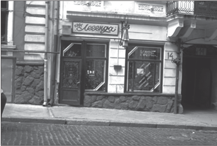
Abb. 3: Typischer Kleinbetrieb im Stadtzentrum von Czernowitz. ‚Café Legenda‘.