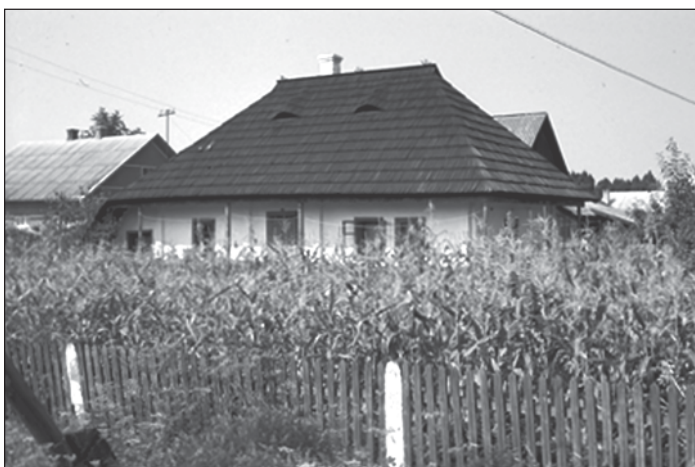
Abb. 2: Traditionelles Bauernhaus mit geteerten Legschindeln gedeckt und umgeben von einem Kukuruzfeld. In den östlichen Vorkarpaten bei Storoschinez.

Der Wegfall der engen, vor allem zwingend vorgegebenen staatlichen Strukturen durch die Auflösung der Sowjetunion 1991 macht sich ganz besonders im Rückfall des ländlichen Raumes dieser Großregion bemerkbar. Die Revolution und der darauf folgende Bürgerkrieg von 1918 bis 1921 leiteten eine Reihe von Veränderungen im ländlichen Raum der Ukraine ein, die in weiten Landesteilen zu einer tief greifenden Umgestaltung von Fluren und Ortschaften führte. Diese Veränderungen verstärkten sich bis in die 50iger Jahre des 20. Jahrhunderts und zerstörten bzw. schädigten die gewachsenen Strukturen des