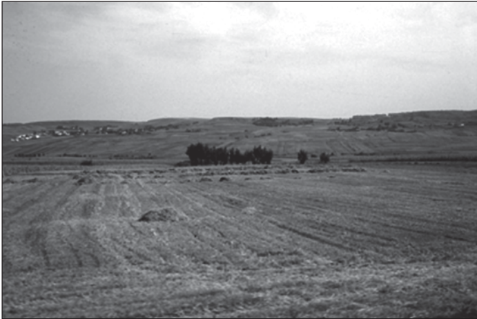
Abb. 8: Auf der Hauptverbindungsstraße zwischen Czernowitz und Suceava bei Sireth. Im rumänischen Teil der Südbukowina lässt sich ein der Realteilung ähnliches Bild in der Landschaft feststellen. Die landwirtschaftlichen Staatsbetriebe wurden zu Beginn der 90iger Jahre zugunsten der Bauern in gesetzlich vorgeschriebene, kleine Einheiten aufgeteilt. Eine neuerliche Landreform sprach den Bauern weiteres Land zu, was zu z.T. weit auseinander liegenden Flurstücken führte.

Wissenschaft herauszuheben. Diese Entwicklung lässt sich mit anderen Kronländern wie etwa Tirol-Vorarlberg vergleichen. Hatten in Tirol u.a. Hermann Wopfner (1876-1963) und Otto Stolz (1881-1957) mit einer solchen Landeskunde begonnen, so war es in der Bukowina im wesentlichen Raimund F. Kaindl (1866-1930) und sicherlich auch Franz A. Wickenhauser (1809-1891). 4