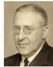
VICTOR FRANZ HESS

Seine Ausbildung erhielt der am 24.6.1883 geborene Victor Franz Hess in Graz, wo er 1906 „Sub auspiciis Imperatoris“ promovierte. Von 1910 bis 1920 arbeitete er am neu gegründeten Institut für Radiumforschung der Österreichischen Akademie der Wissenschaften in Wien. 1912 entdeckte Hess die Kosmische Strahlung, die er noch Höhenstrahlung nannte – wofür er 1936 den Nobelpreis für Physik erhielt. 1919 wurde Hess als außerordentlicher Professor an die Universität Graz berufen, ab 1931 war er als Professor an der Universität Innsbruck tätig. 1937 wurde er neuerlich an die Universität Graz berufen. Als Gegner des Nationalsozialismus wurde Hess nach dem Anschluss Österreichs an das Deutsche Reich kurzfristig verhaftet, in den vorläufigen Ruhestand versetzt und im September 1938 fristlos entlassen. 1938 emigrierte er in die USA, wo er am 17.12.1964 in Mount Vernon, New York starb.