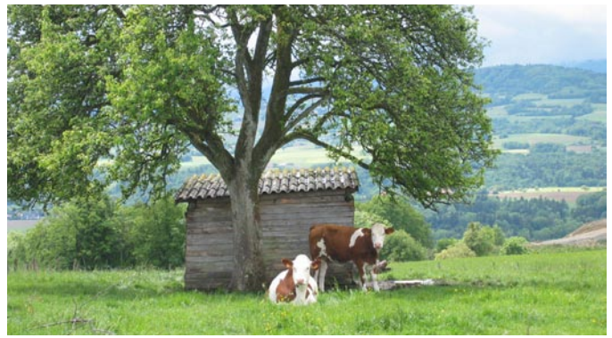
Les images traditionnelles des Alpes...

De plus, confronter les réponses des experts impliquait de tenir compte de facteurs susceptibles d'influencer leurs avis. Les différences d'opinions peuvent retracer