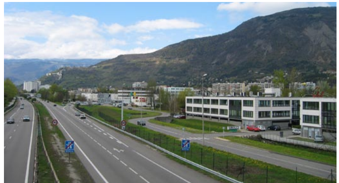
... en conflit avec un quotidien moins romantique