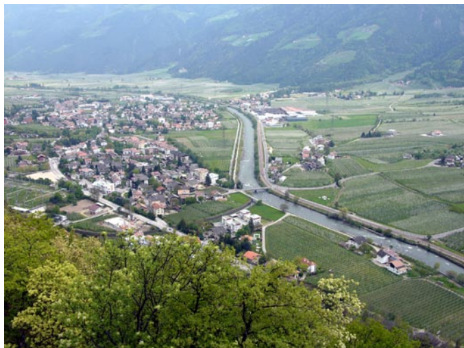
La qualité de vie dans les Alpes, un atout majeur (Etschtal)